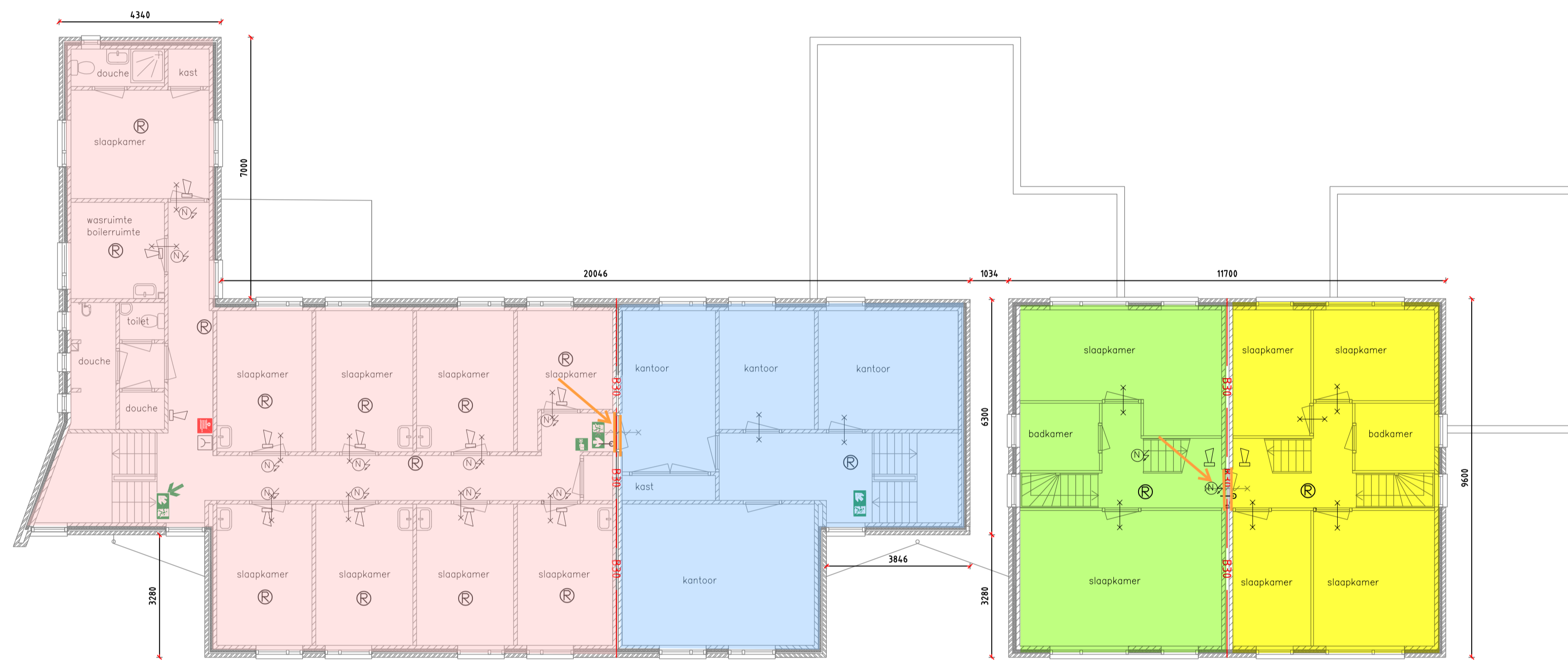
1e VERDIEPING (h= 3 m +peil)